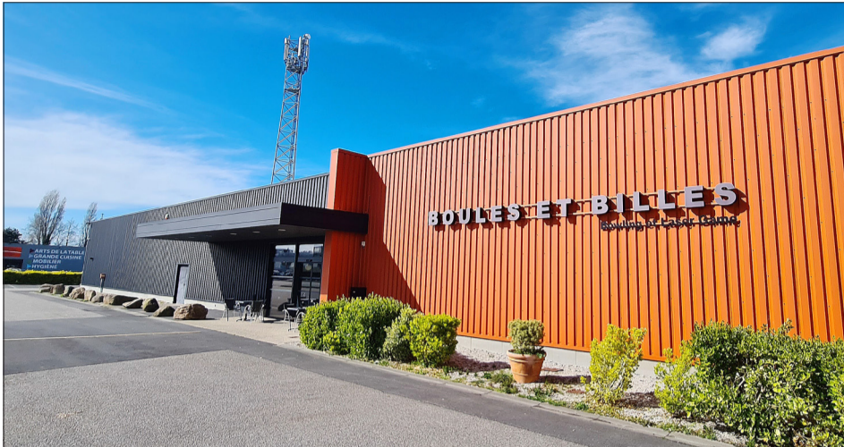
Pierrick Laurence a repris le bowling Boules et Billes, 511 rue du Conillot.