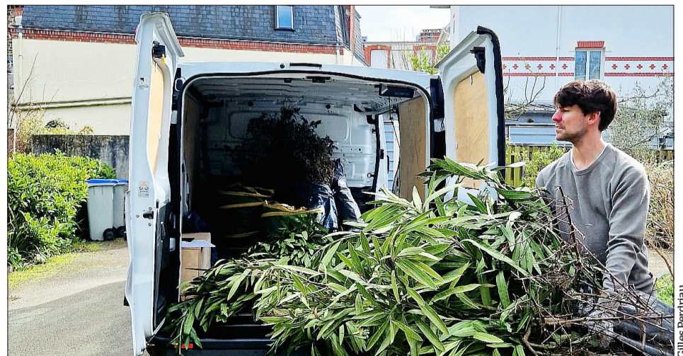
Batiste Gontran, créateur de l'entreprise Home Collect', propose un service à domicile pour la prise en charge et l'acheminement des déchets vers les voies de traitement ou de recyclage appropriées.

■ Pratique. Tél. 06 77 49 55 43. Mail : contact@homecollect.fr .